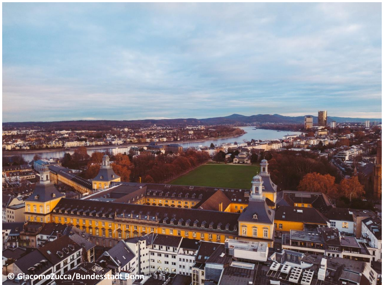
Bonner Stadtansicht mit Universität im Vordergrund