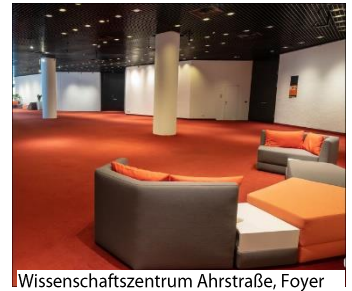
Wissenschaftszentrum Ahrstraße, Foyer

Alle weiteren Kosten und Risiken im Zusammenhang mit dem Bau und der Betreibung des Standes trägt der jeweilige Standbetreiber.